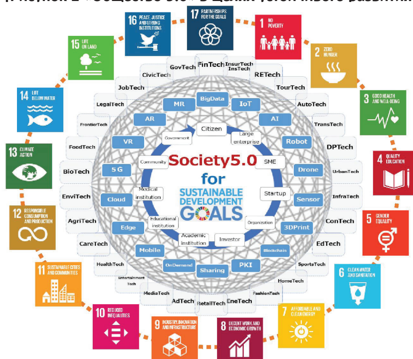
[Рисунок 2 «Общество 5.0» в Целях устойчивого развития]

Мы признаём, что существуют вызовы, являющиеся потенциальными результатами цифровизации, такие как существенные изменения на рабочих местах, увеличение социального неравенства, вызванного накоплением данных, и потенциальный риск формирования общества тотальной слежки со значительной потерей неприкосновенности частной жизни. Однако мы считаем, что эффективное использование Интернета вещей, больших данных и искусственного интеллекта позволит нам использовать творческий потенциал человека и создать новое общество будущего с использованием передовых технологий. Преимущества, вытекающие из использования этих технологий, включают в себя: 1) обнаружение знаний и скрытых закономерностей в данных намного эффективнее человека; 2) автоматическое выявление закономерностей и обнаружение аномалий в данных; 3) обеспечение большей точности; 4) повышение эффективности работы и прогнозирование сбоев оборудования; 5) повышение эффективности управления рисками; 6) предотвращение дорогостоящих незапланированных простоев в ряде отраслей; и 7) создание возможностей для появления новых и улучшенных продуктов и услуг. При этом мы признаём необходимость сотрудничества между государственным и частным секторами, с тем, чтобы такая трансформация никого не оставила позади. С этой целью правительствам необходимо в тесном взаимодействии с деловыми кругами принять конкретные и безотлагательные меры и выработать регламентированные подходы в семи нижеуказанных областях.